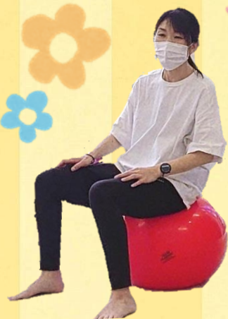
わこねっこ認定バランスボール エクササイズインストラクター