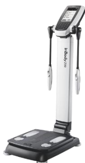
InBodyによる体組成計測定

InBody（体成分分析装置）での体組成計測定とトレーナーから個別指導（パーソナルトレーニング）が受けられます。