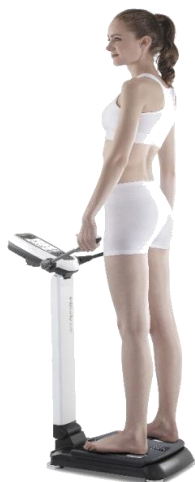
測定時の様子。3分程度で終了。 (ペースメーカー及び妊娠中の方はご遠慮ください。)

簡単な測定で体脂肪量、筋肉量など結果表で確認できます。 ご依頼会場に測定機器を持出しできますので、運動の成果確認や健康づくりにご活用ください。